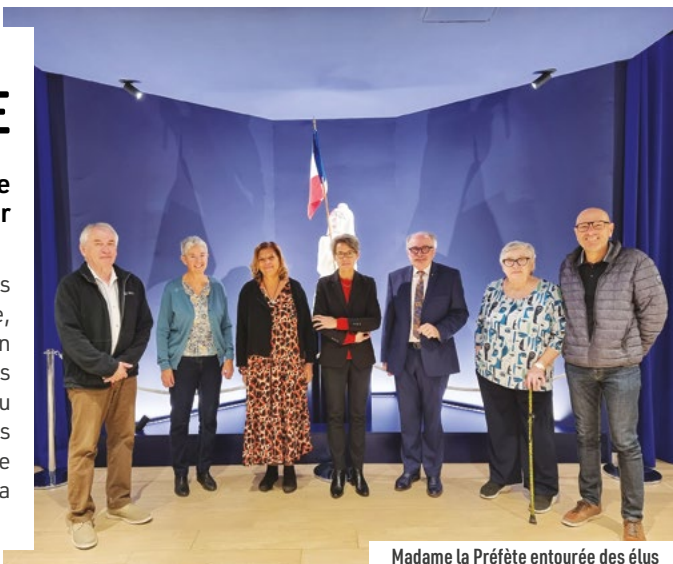
Madame la Préfète entourée des élus

Cette première rencontre a été l'occasion de faire des présentations, à la fois des élus, mais aussi de la commune, à travers ses différents projets réalisés, et de ses dossiers en cours. Madame la Préfète s'est montrée attentive et à l'écoute des intervenants, et a souhaité pouvoir participer à la cérémonie du 11 novembre organisé sur la commune. Monsieur le Maire et les élus ont remercié madame la Préfète pour cette première prise de contact, et ont exprimé leur gratitude pour l'intérêt qu'elle a manifesté à l'égard de la ville de Saint-Genest-Lerpt.