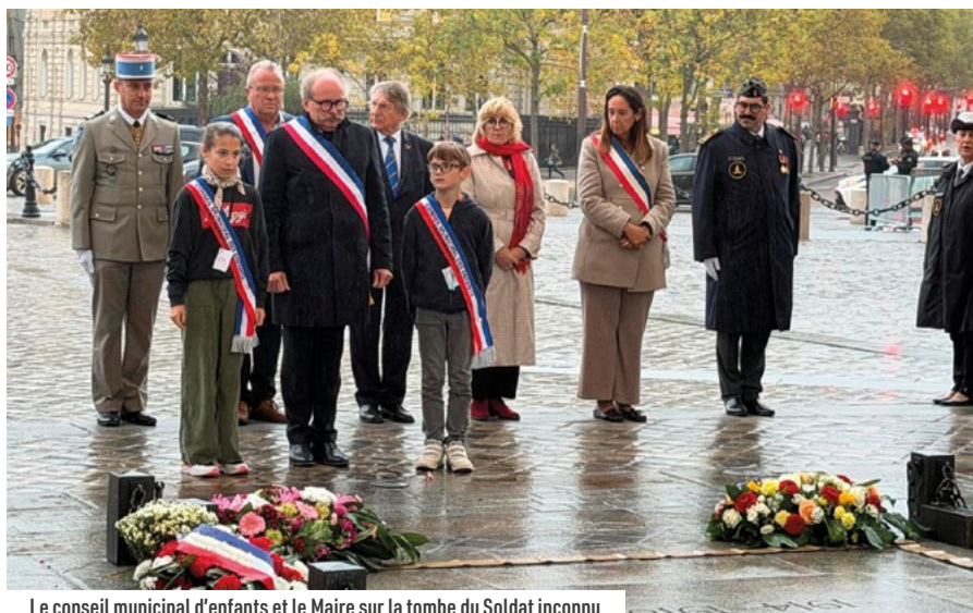
Le conseil municipal d'enfants et le Maire sur la tombe du Soldat inconnu

Le conseil municipal des enfants a eu l'occasion, pendant les vacances de la Toussaint, de se rendre à Paris pour visiter le Sénat.