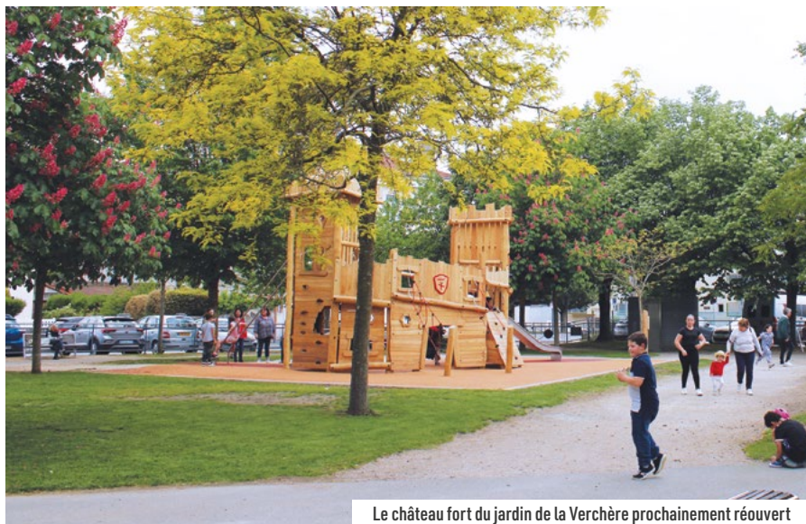
Le château fort du jardin de la Verchère prochainement réouvert

Nous avons eu à déplorer ces dernières semaines, deux accidents sur le château fort, un jeu installé à la Verchère, qui a nécessité une fermeture temporaire de cette structure.