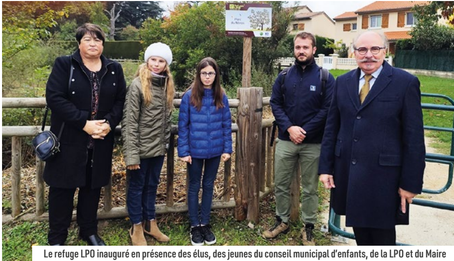
Le refuge LPO inauguré en présence des élus, des jeunes du conseil municipal d'enfants, de la LPO et du Maire

Le parc du Minois bénéficie du label « refuge LPO » depuis 11 ans. Décerné par la Ligue pour la protection des oiseaux, il a été renouvelé en 2023 pour cinq nouvelles années et vient d'être inauguré le 5 octobre dernier. Le but de ce label ? Accueillir, protéger et favoriser la nature, mais aussi sensibiliser le public à travers des actions pédagogiques.