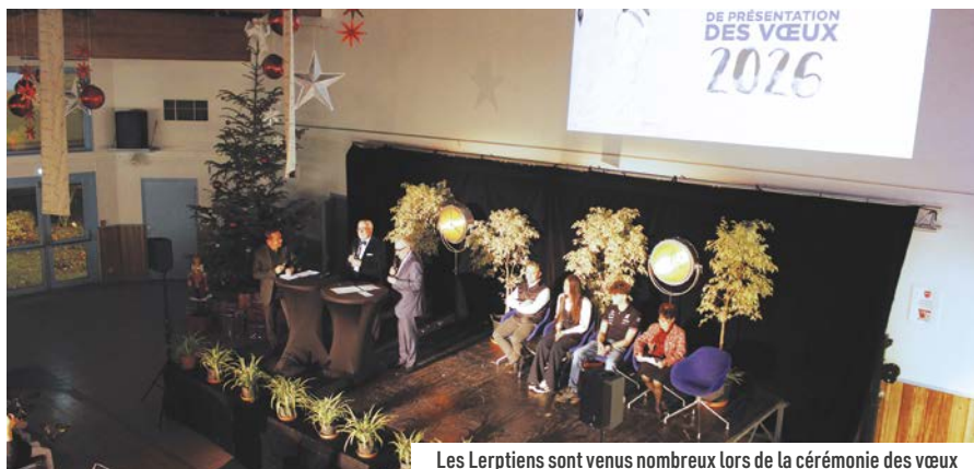
Les Lerptiens sont venus nombreux lors de la cérémonie des vœux

Le 9 janvier, la cérémonie de présentation des vœux a, comme le veut la tradition, rassemblé les acteurs de la vie locale ainsi que de nombreux habitants.